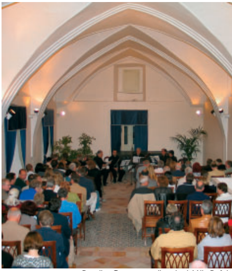
Ravello: Concerto nelle sale di Villa Rufolo