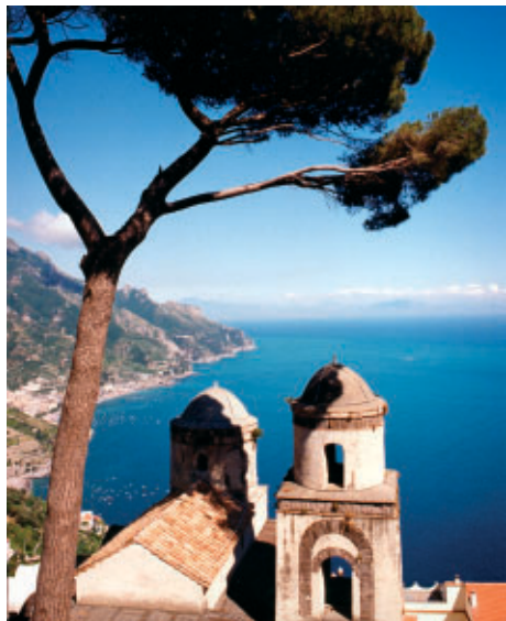
Ravello - Panorama da Villa Rufolo